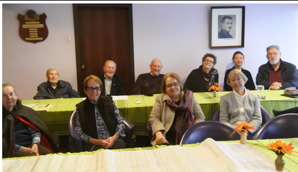
PLDK pēdējās pilnsapulces dalībnieki: "Bija skaisti laiki! Un paliek tikai atmiņas."